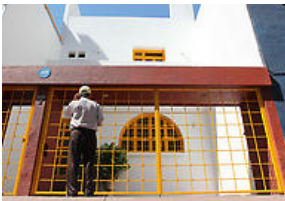
Recorrido por obra de Luis Barragán