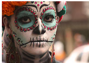
Catrinan toman el Centro tapatio