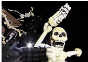
Preparativos para 'Día de Muertos'