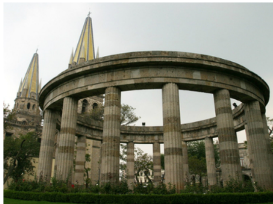
Las gavetas con los restos de jaliscienses ilustres, permanecerán en su lugar, el problema es el espacio para las esculturas.

Guadalajara | Patrimonio | Rotonda de los Jaliscienses Ilustres