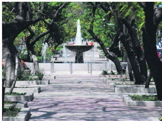
La hoy Avendida Chapultepec se llamó Lafayette y entorno a ella se construyeron las primeras colonias residenciales.ESPECIAL