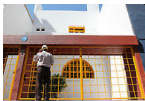
Recorrido por obra de Luis Barragán